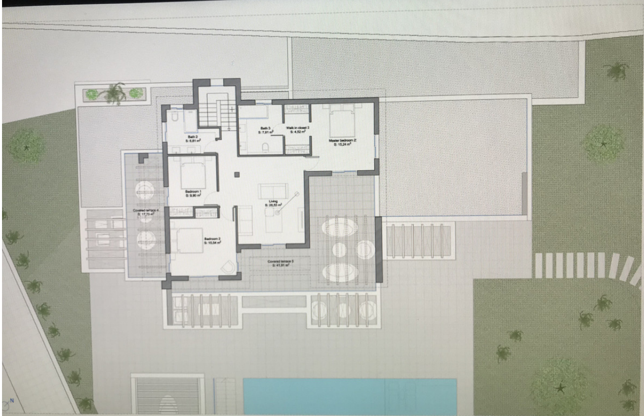
P04 HOUSING IN "URBANIZACIÓN EL HERROJO", 46, BENAHAIVIS (MÁLAGA)