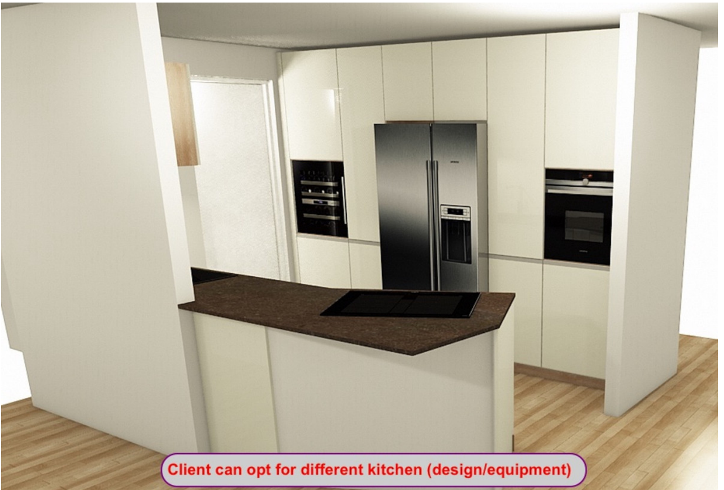
Client can opt for different kitchen (design/equipment)