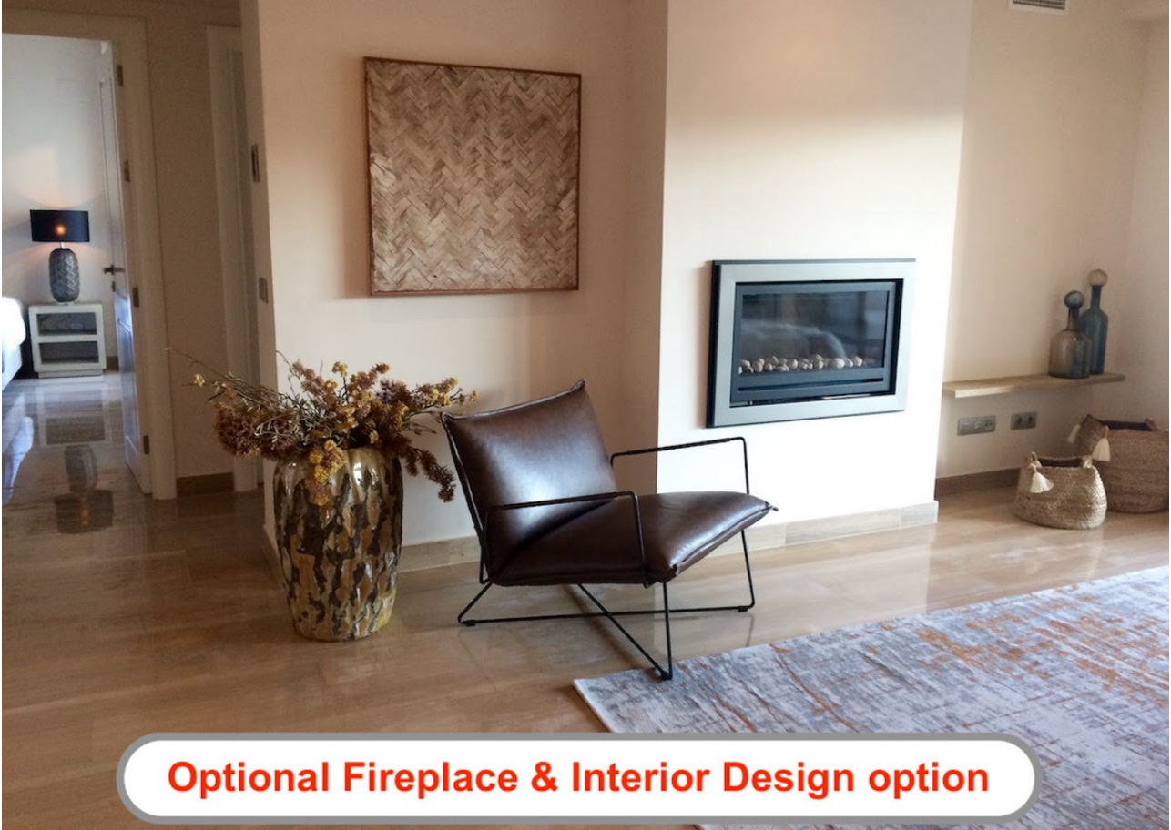
Optional Fireplace & Interior Design option