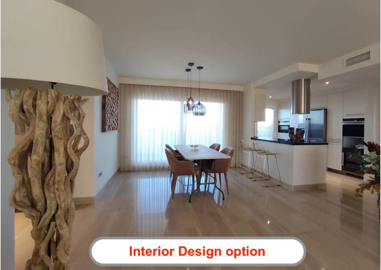
Interior Design option