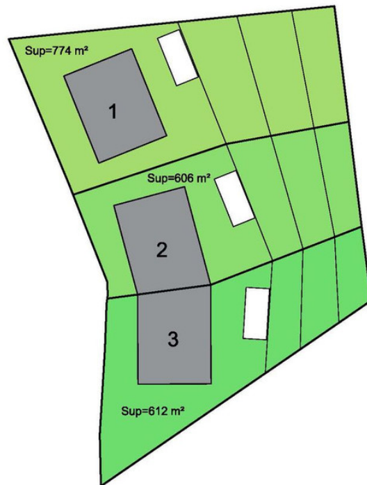
ESTUDIO DE PARCELA URBANA CL ESTOCOLMO 1, BENALMÁDENA ESCALA: s/e