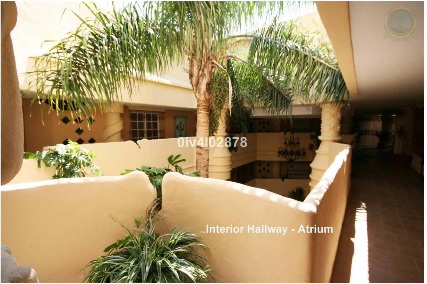
Interior Hallway - Atrium