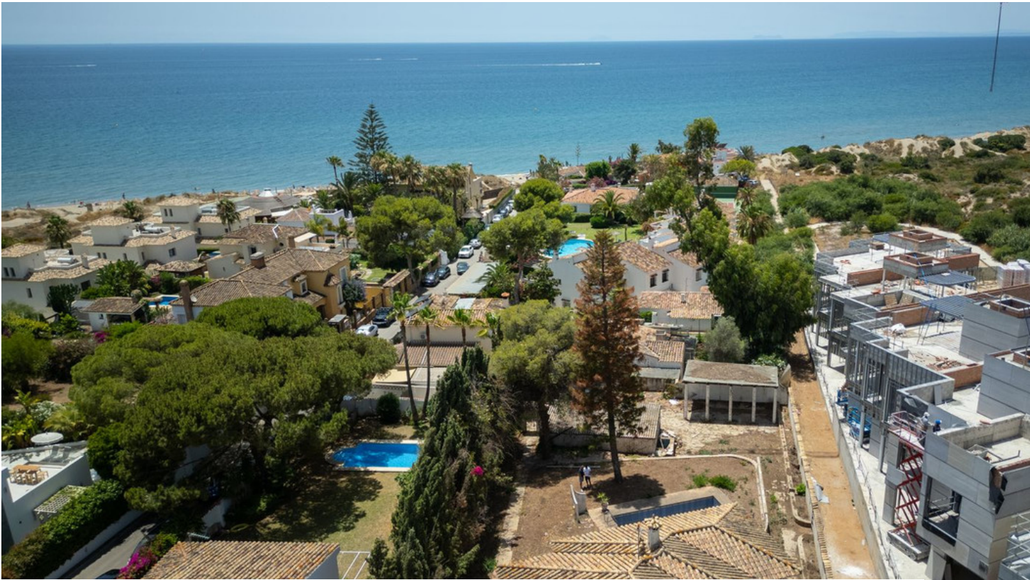
Playas Andaluzas - Basement