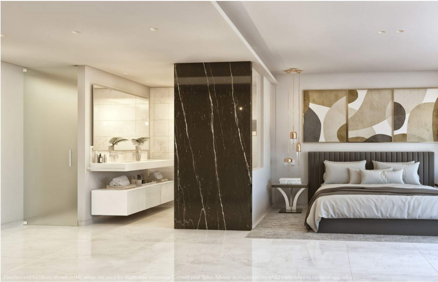
Finishes and furniture shown in this image are used for illustrative purposes. Consult your Sales Adviser in respect of standard materials and optional upgrades.