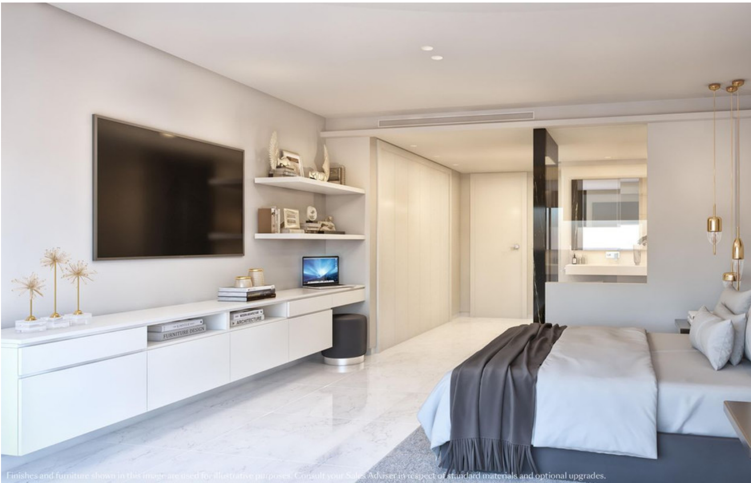
Finishes and furniture shown in this image are used for illustrative purposes. Consult your Sales Adviser in respect of standard materials and optional upgrades.