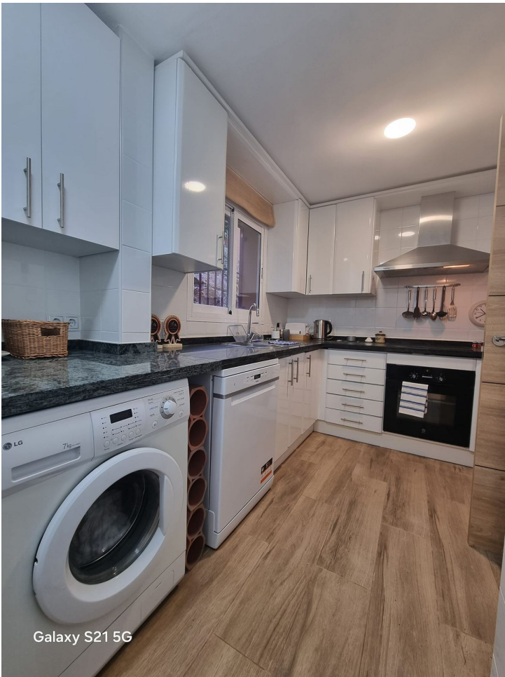
Galaxy S21 5G