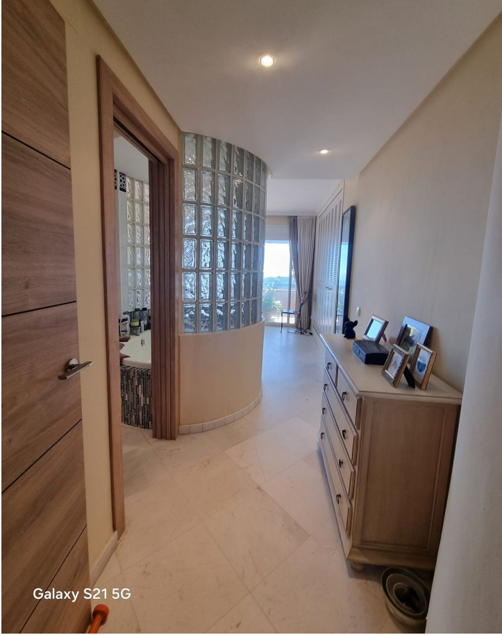
Galaxy S21 5G