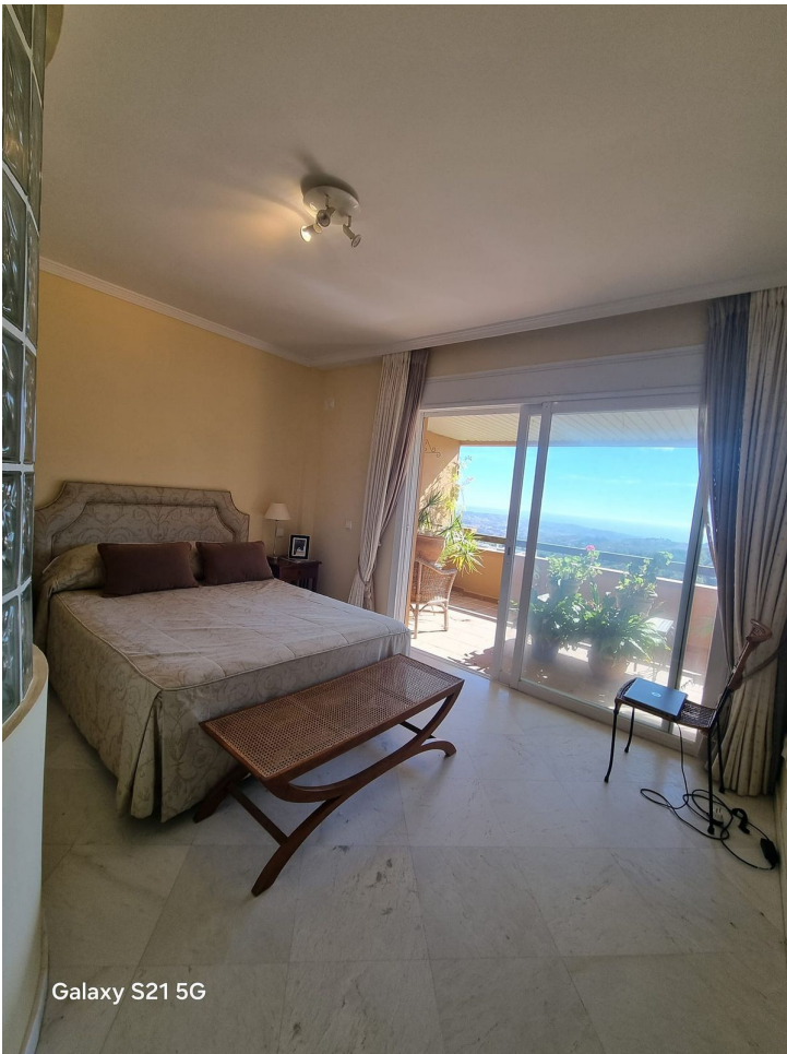
Galaxy S21 5G