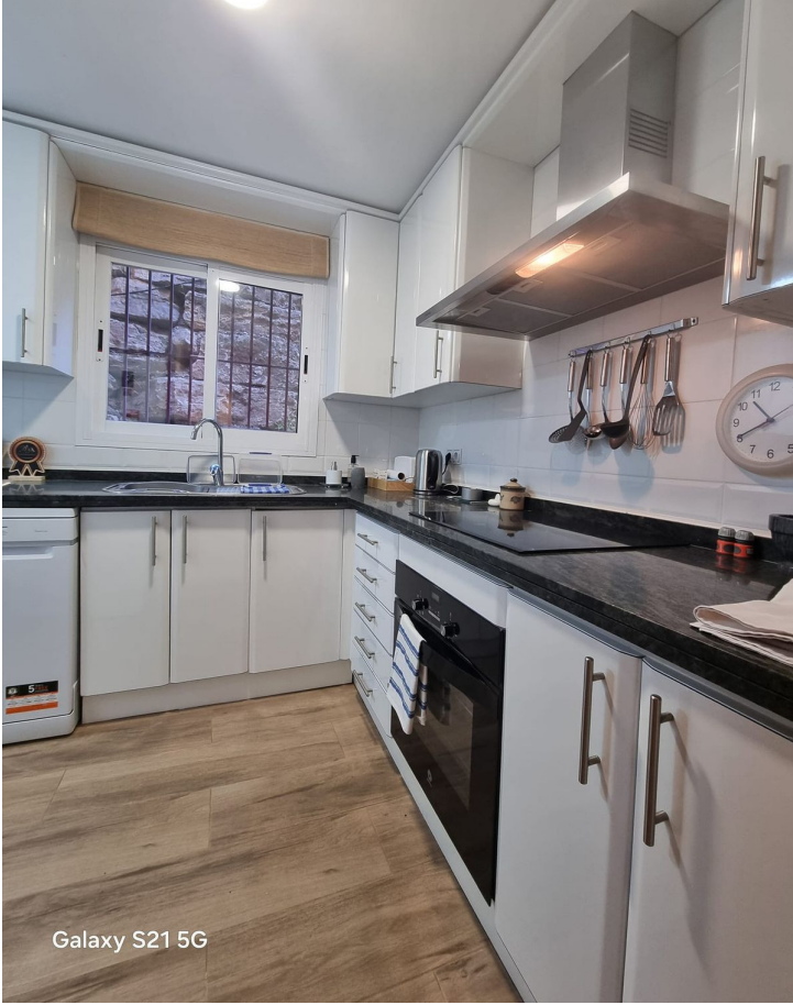
Galaxy S21 5G