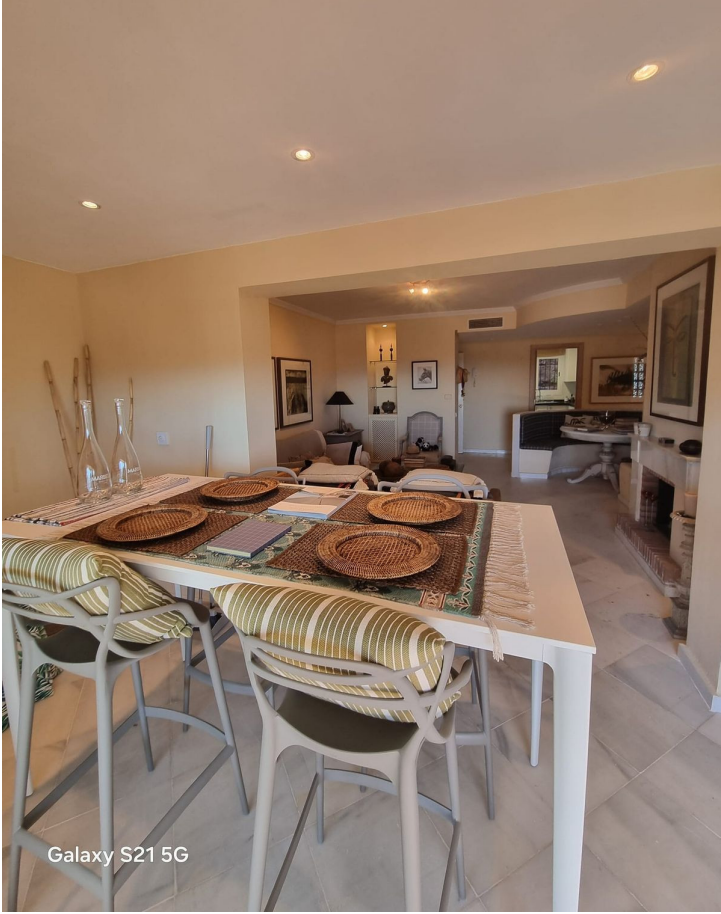
Galaxy S21 5G