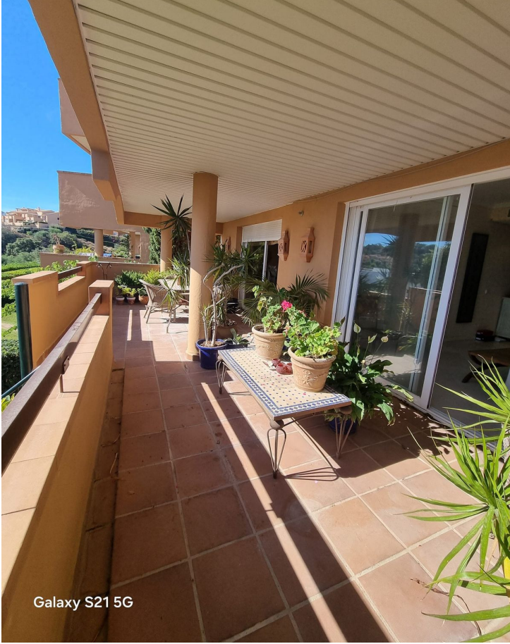
Galaxy S21 5G