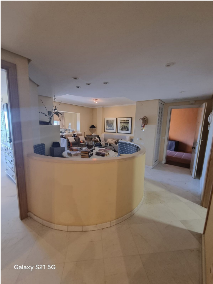
Galaxy S21 5G