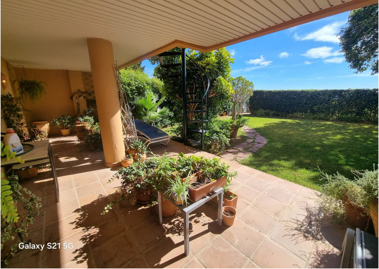
Galaxy S21 5G