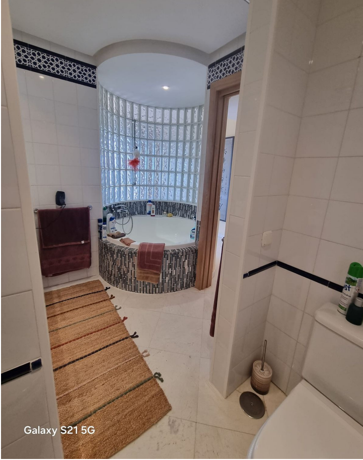
Galaxy S21 5G