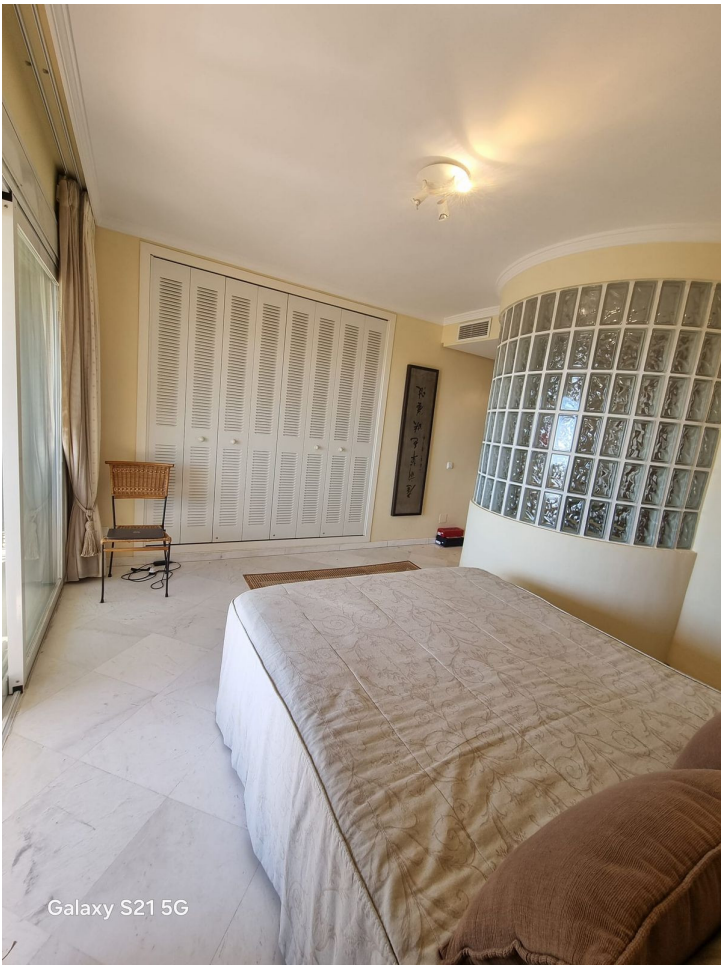
Galaxy S21 5G