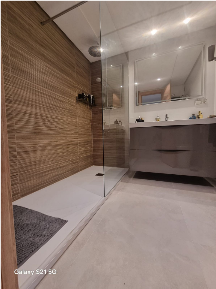
Galaxy S21 5G