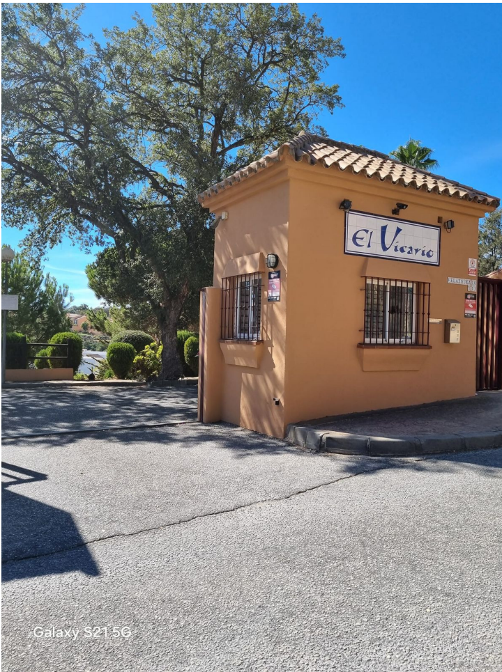
Galaxy S21 5G