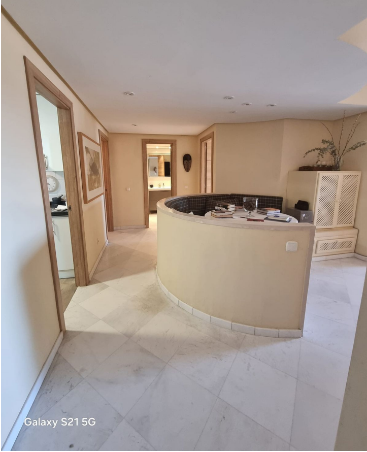
Galaxy S21 5G