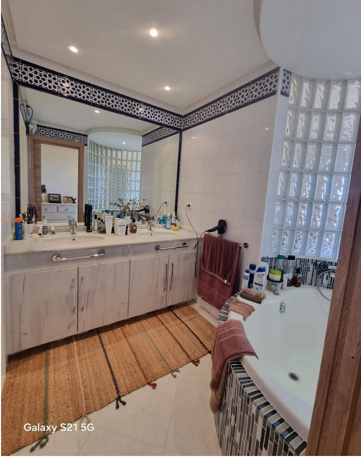
Galaxy S21 5G