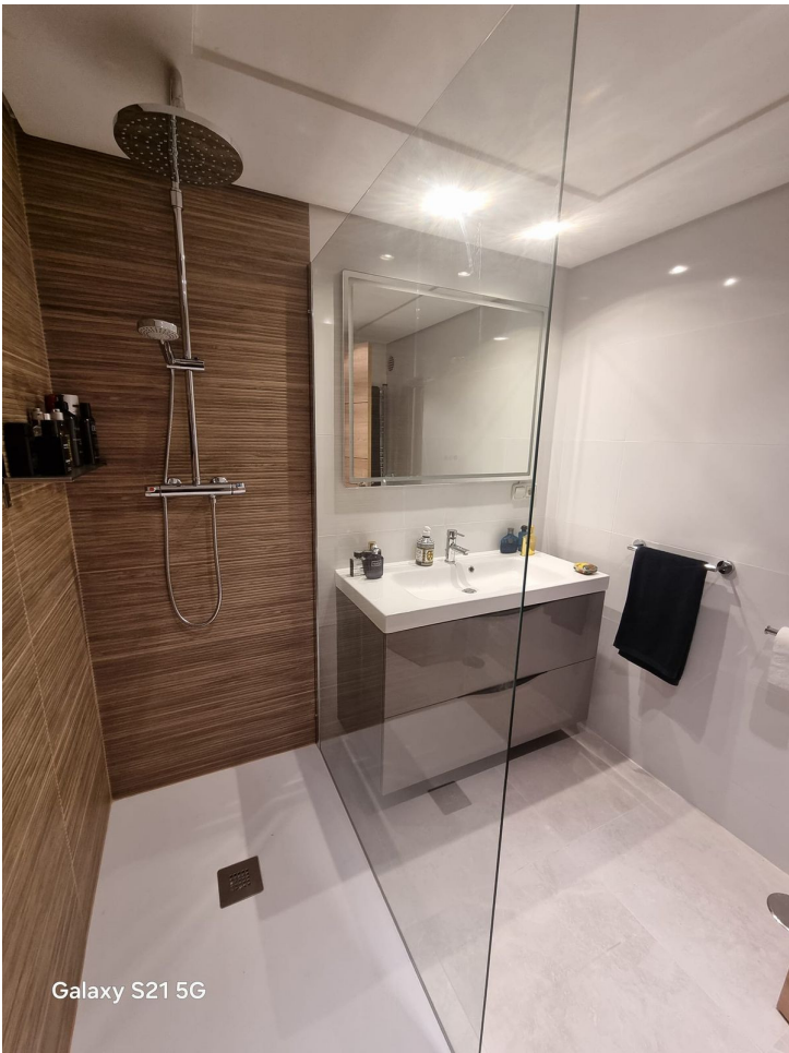
Galaxy S21 5G