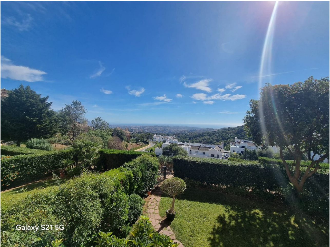
Galaxy S21 5G