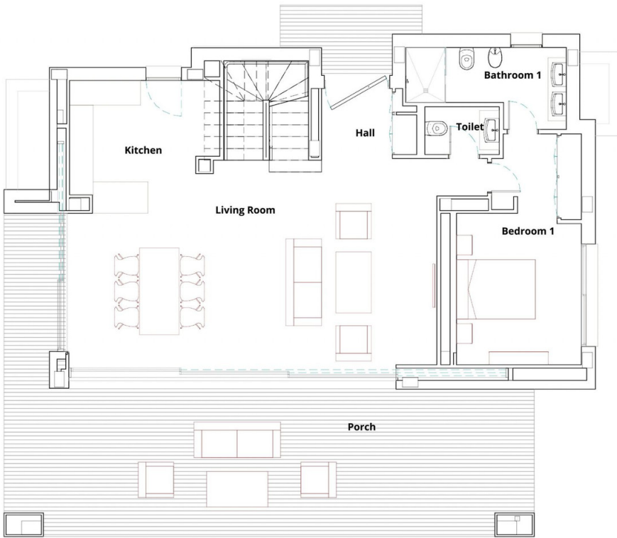
IROKO 4 - BAR GROUND FLOOR