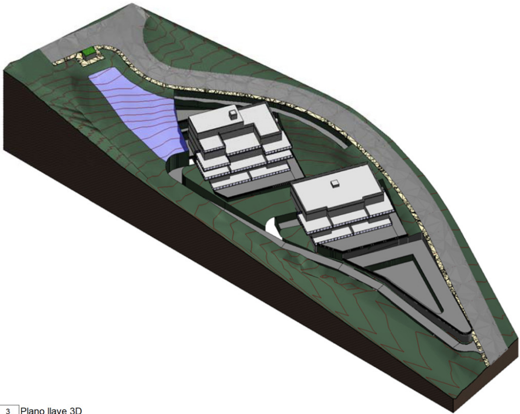
3 Plano llave 3D A103