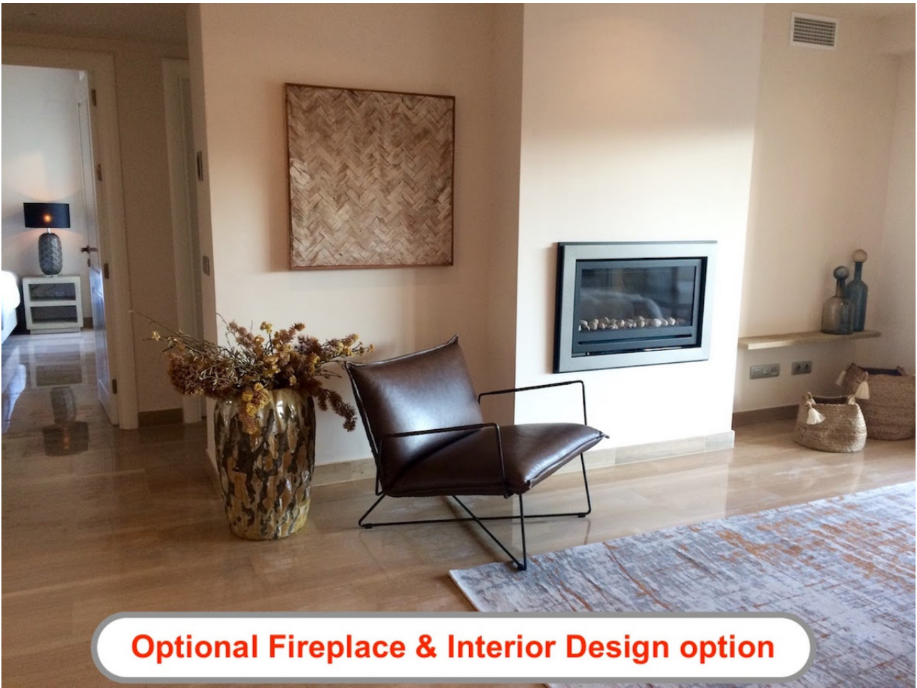
Optional Fireplace & Interior Design option