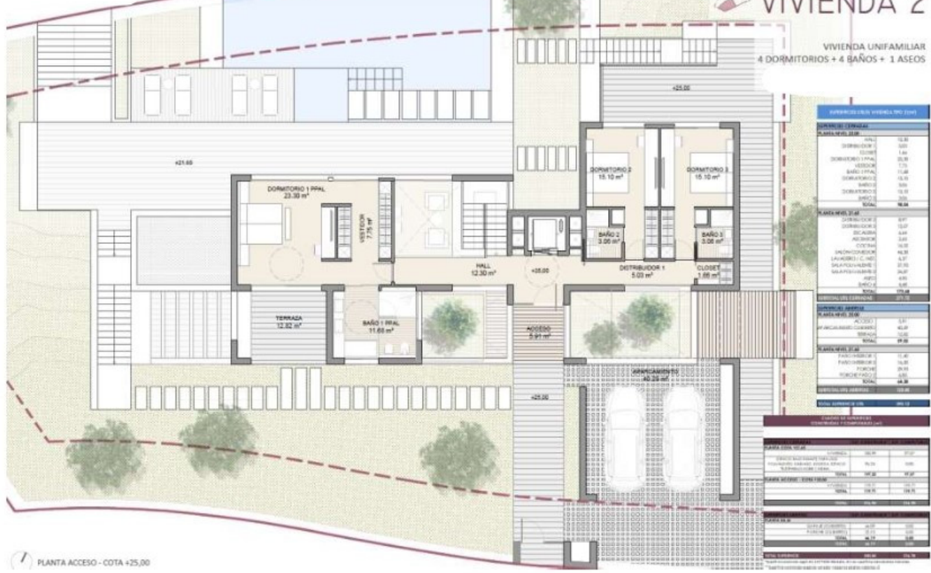
PLANTA ACCESO - COTA +25,00