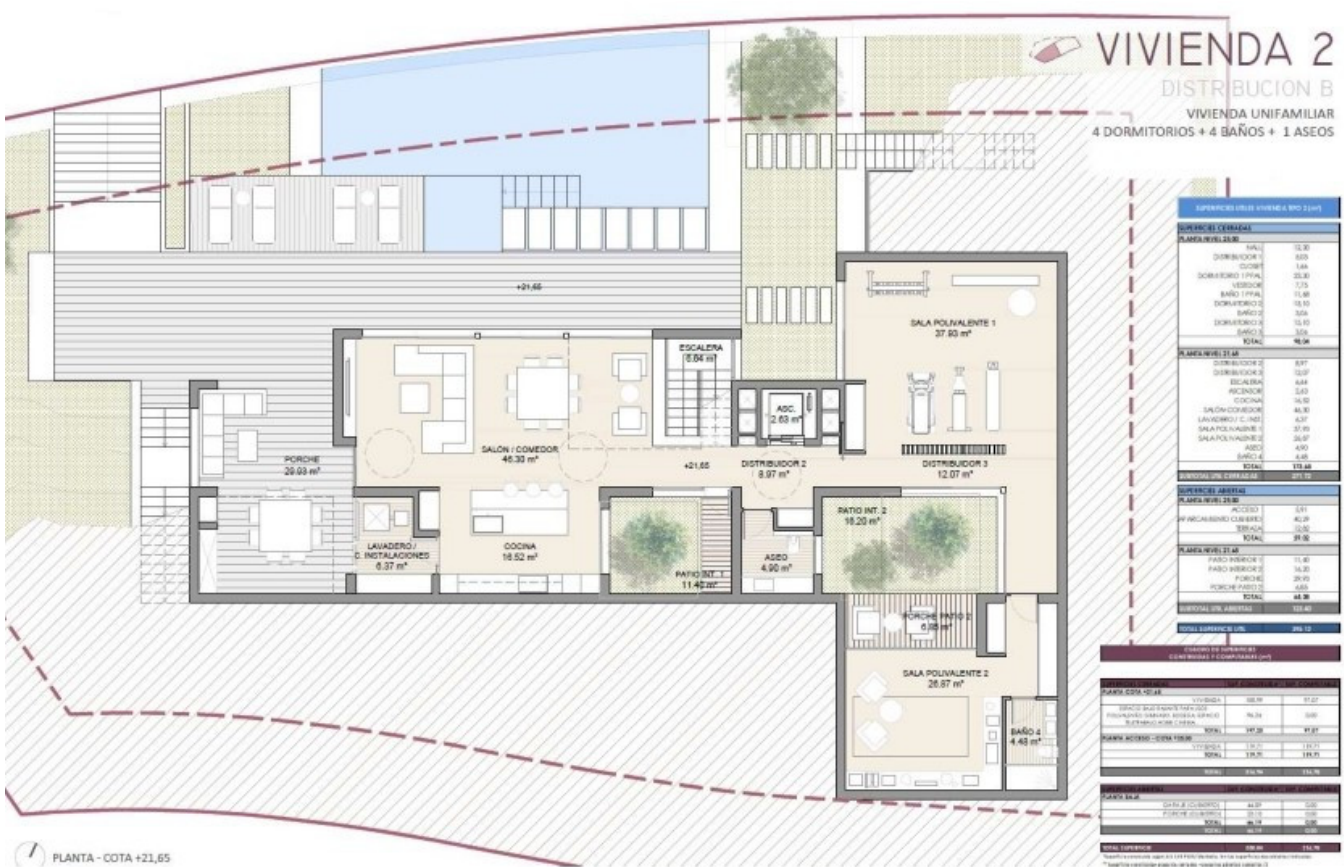
PLANTA - COTA +21,65

NOTA: Documentación informativa sin carácter contractual y meramente ilustrativa, sujeta a modificaciones necesarias por exigencias de carácter técnico, jurídico o comercial de la Dirección Facultativa. El equipamiento de las viviendas será el indicado en la correspondiente memoria de calidades.