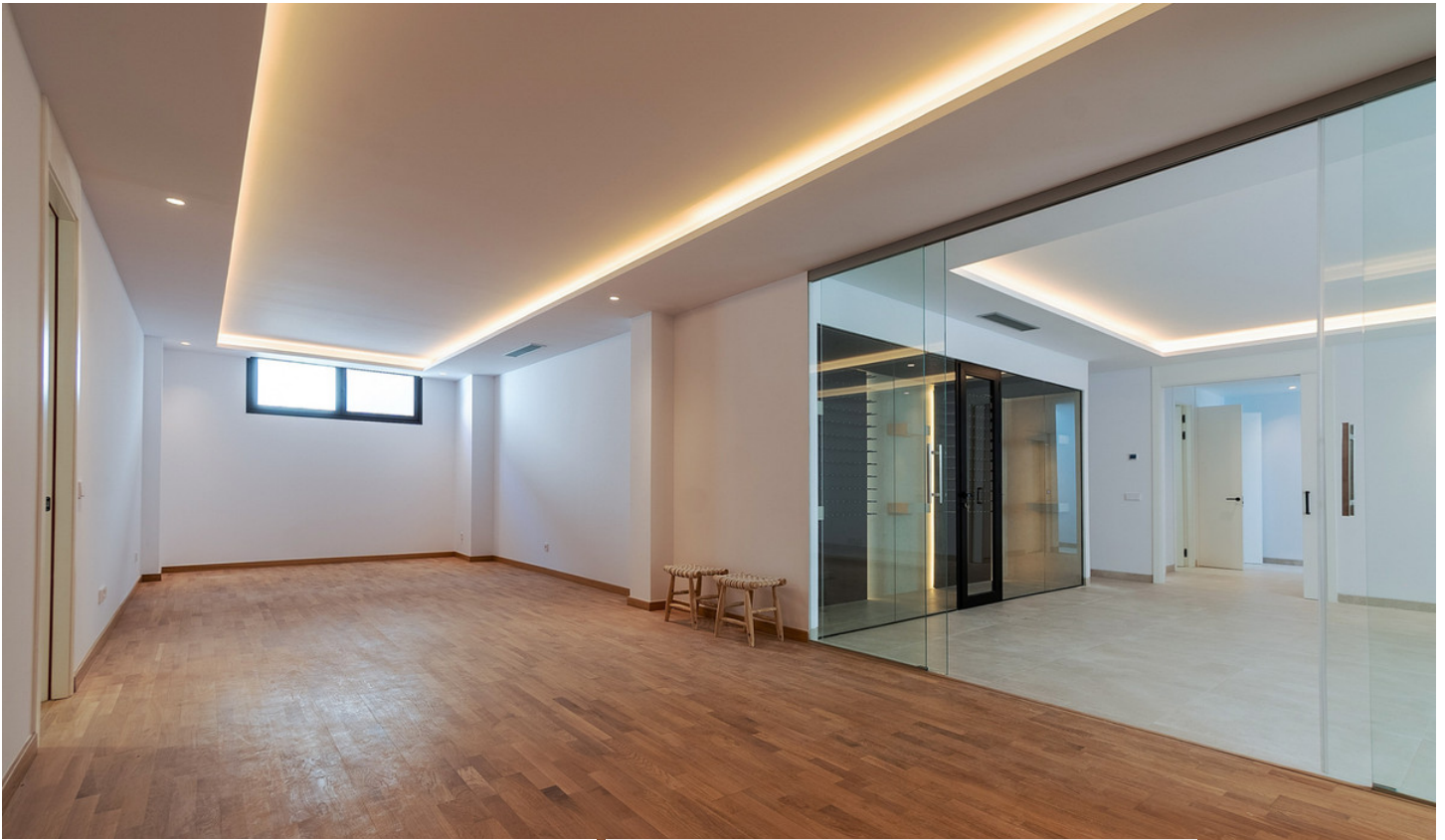
— GROUND FLOOR PLANTA BAJA —