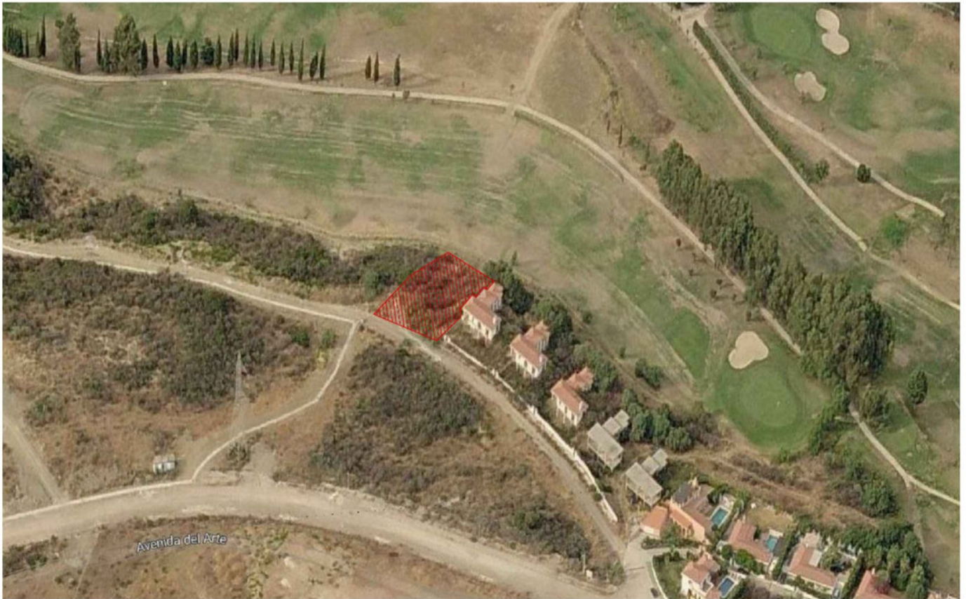
ORTOFOTO VISTA DE PÁJARO ⓘ