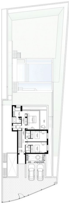
PLANTA PRIMERA FIRST FLOOR