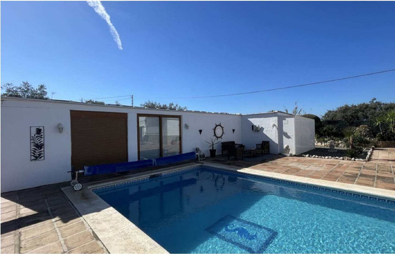
HOUSE 1 Vivienda