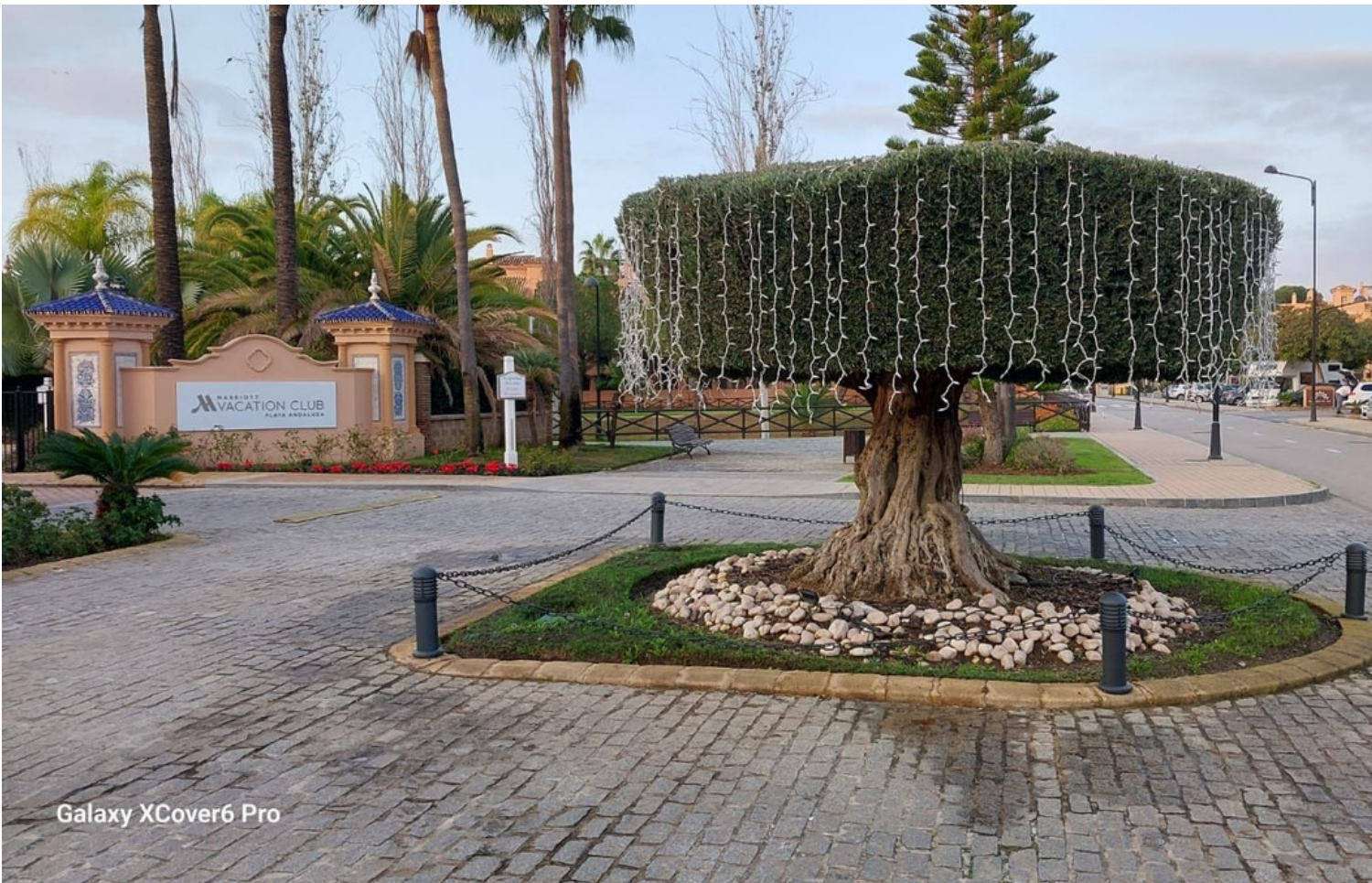
Galaxy XCover6 Pro