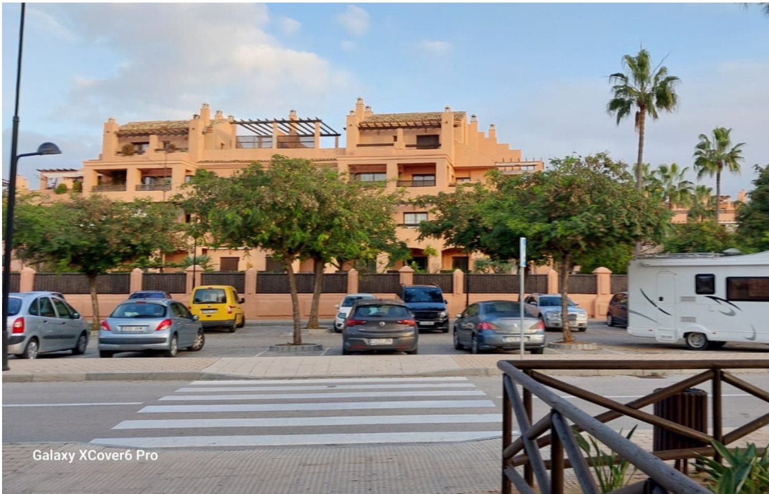
Galaxy XCover6 Pro