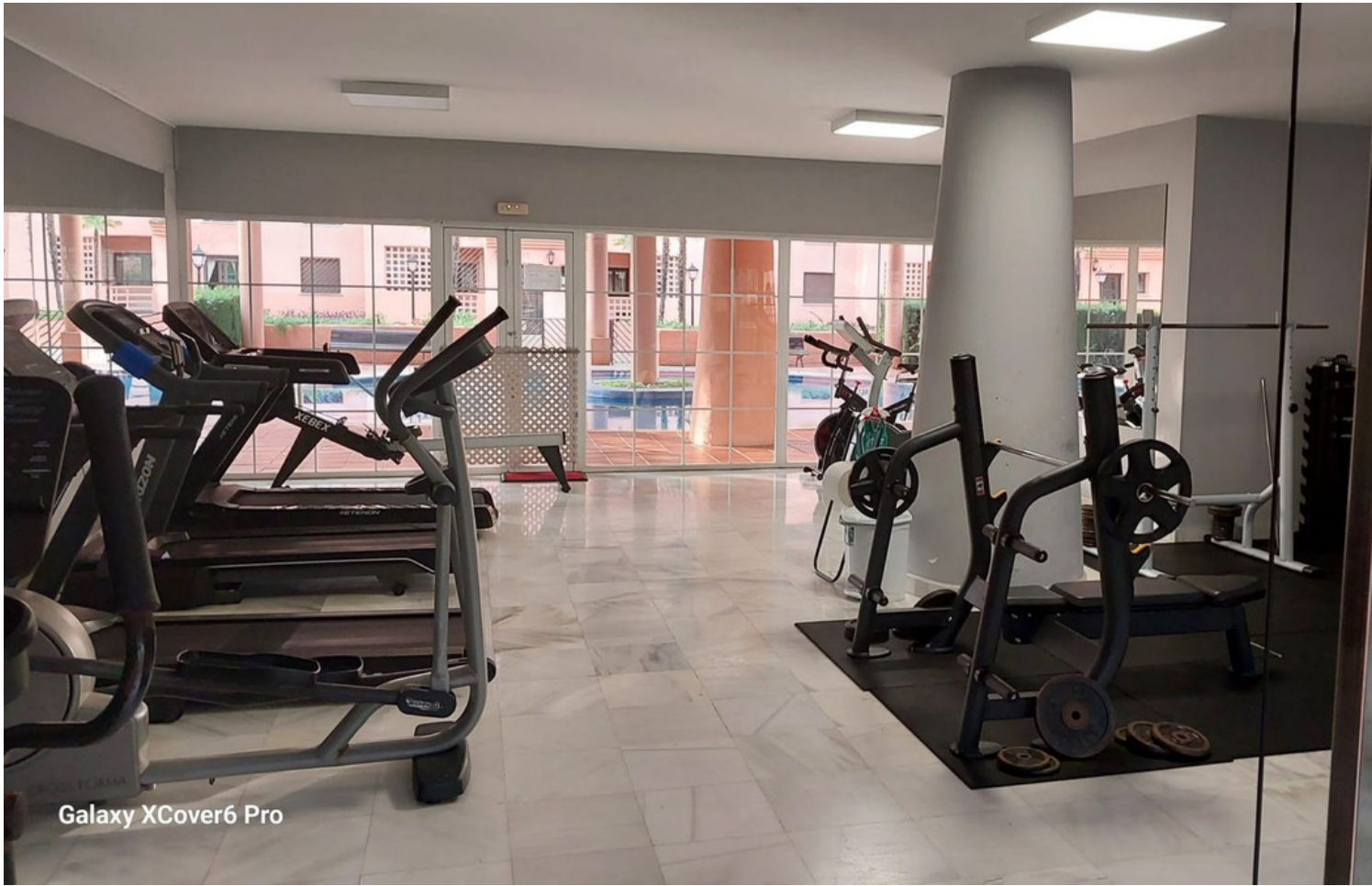
Galaxy XCover6 Pro