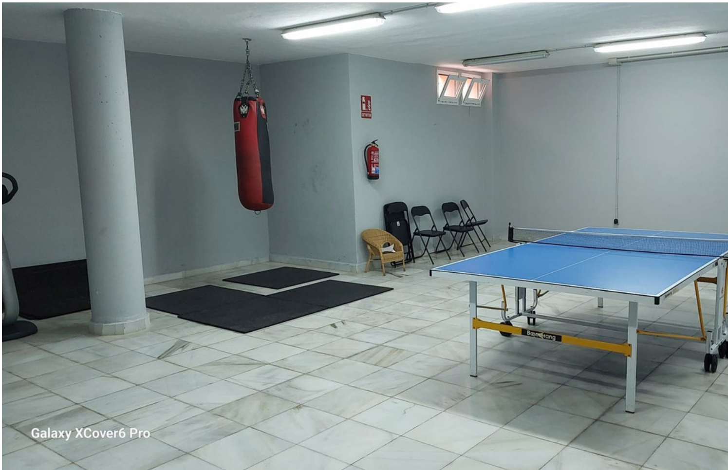
Galaxy XCover6 Pro