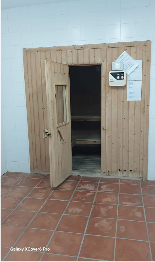
Galaxy XCover6 Pro