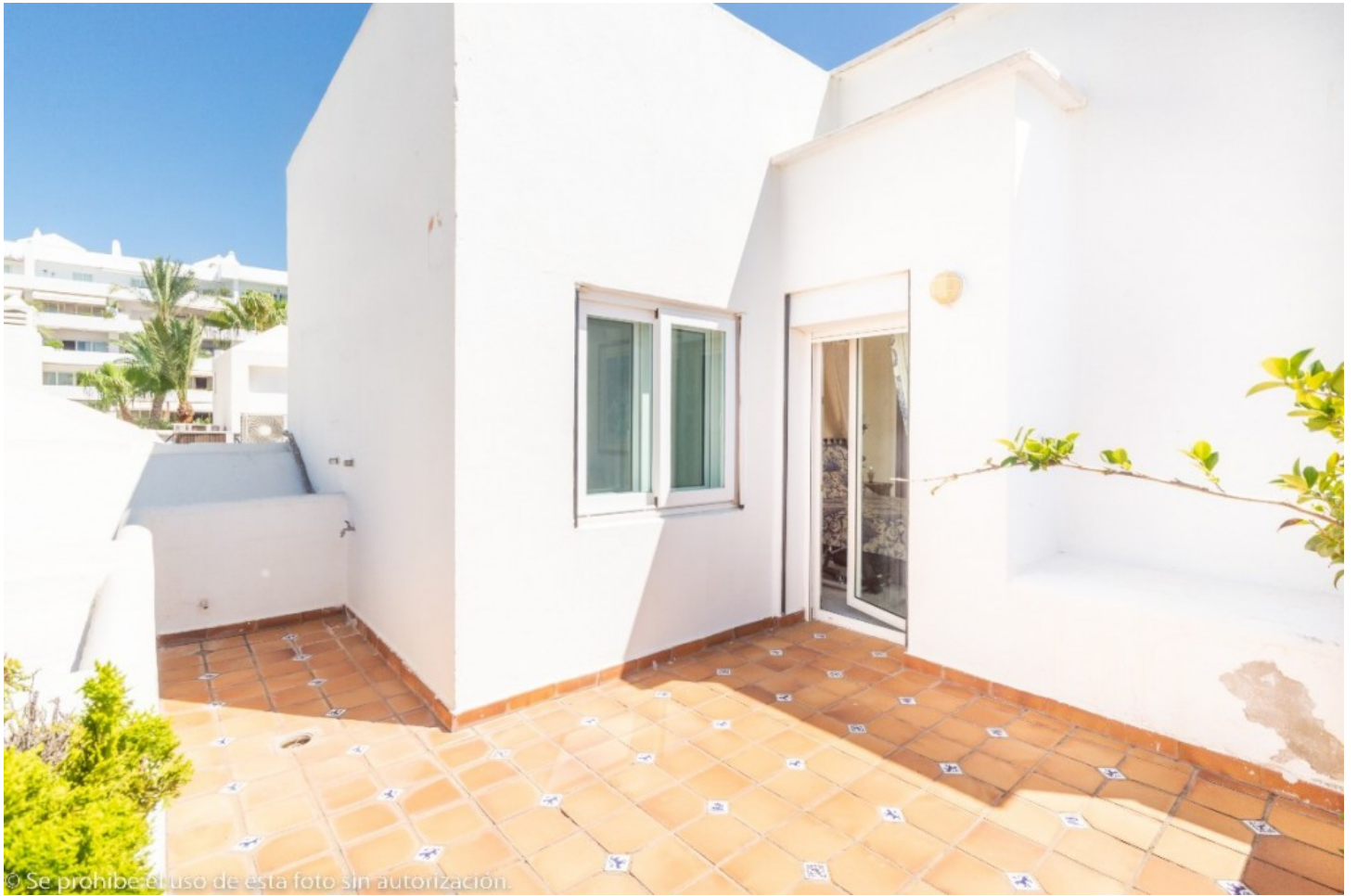
© Se prohíbe el uso de esta foto sin autorización.