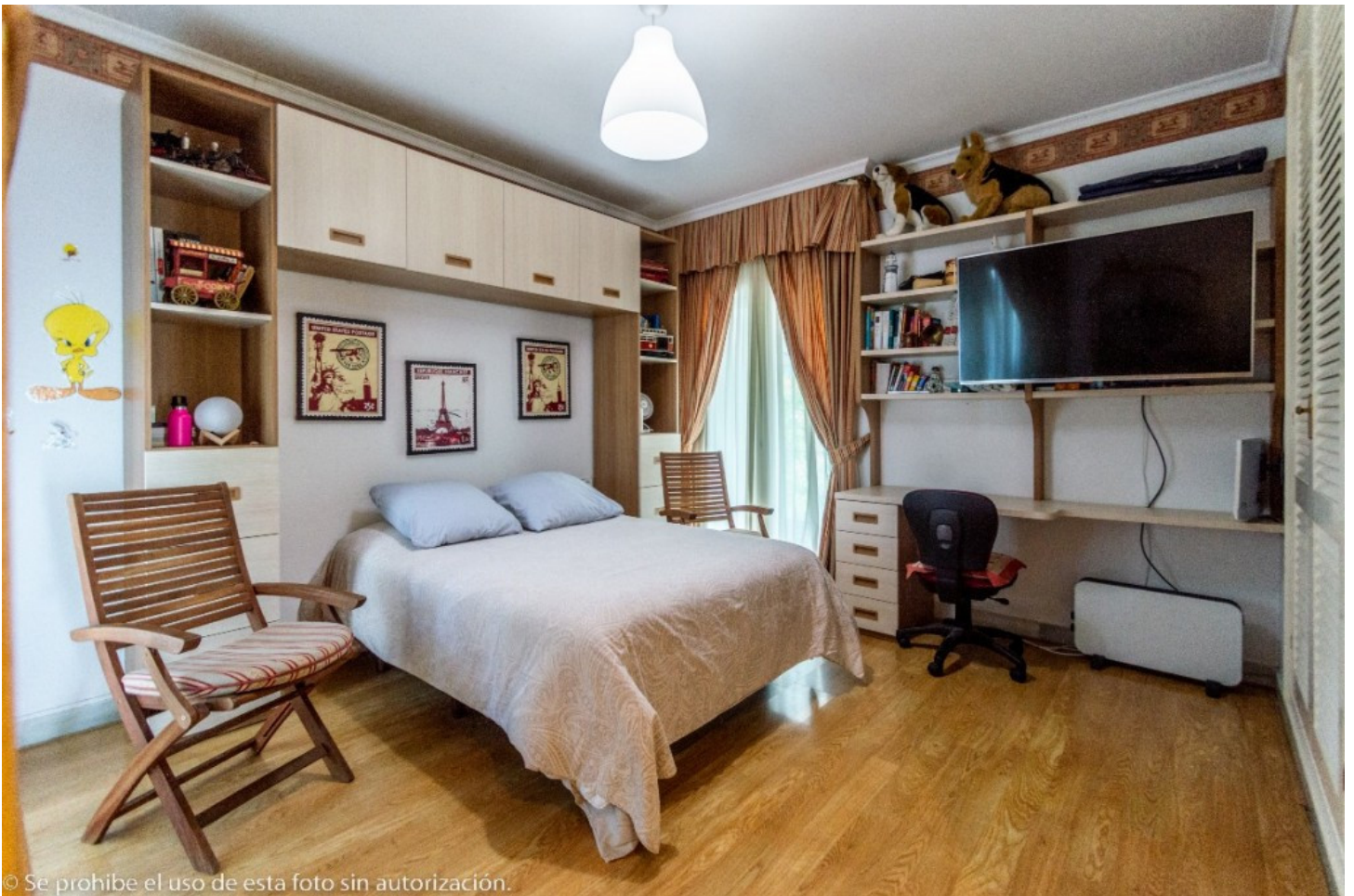
© Se prohíbe el uso de esta foto sin autorización.