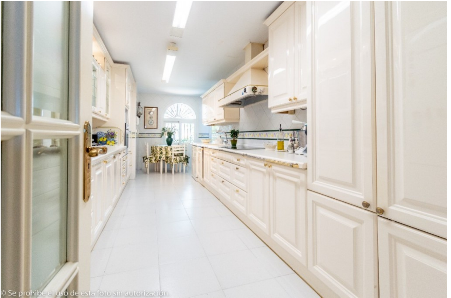
© Se prohíbe el uso de esta foto sin autorización.