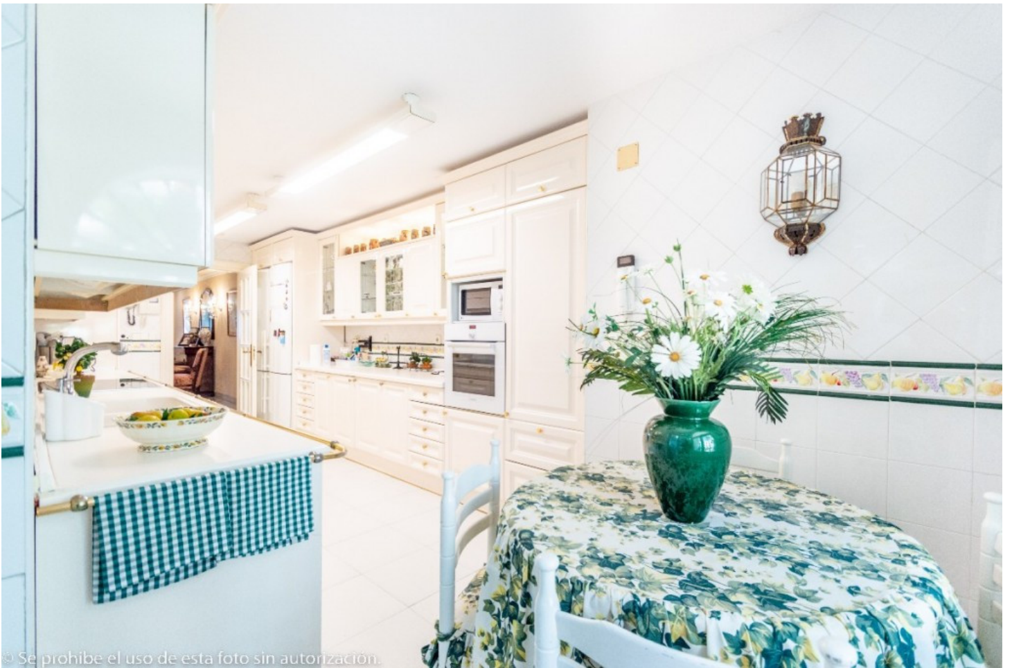
© Se prohíbe el uso de esta foto sin autorización.