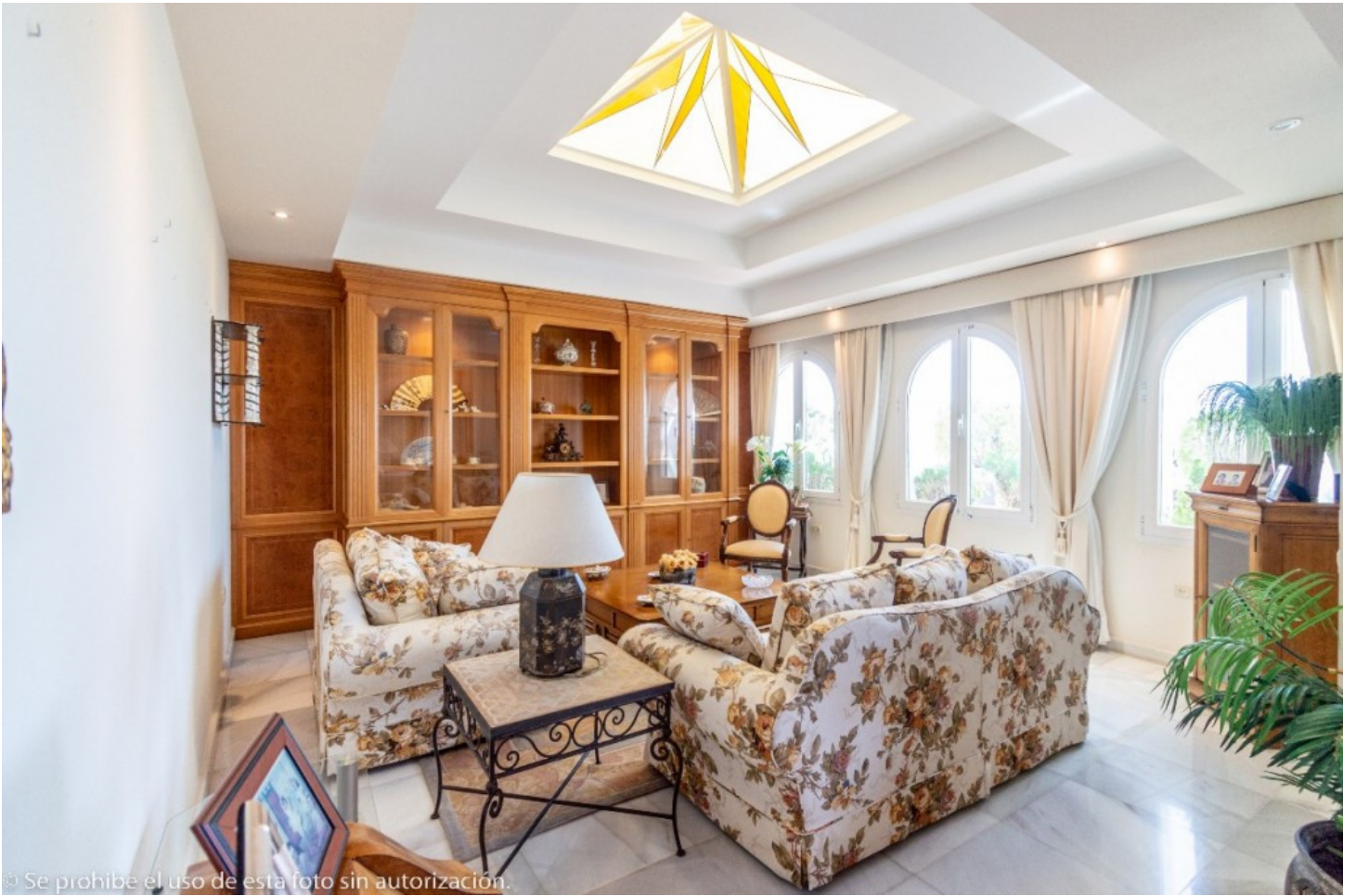
© Se prohíbe el uso de esta foto sin autorización.