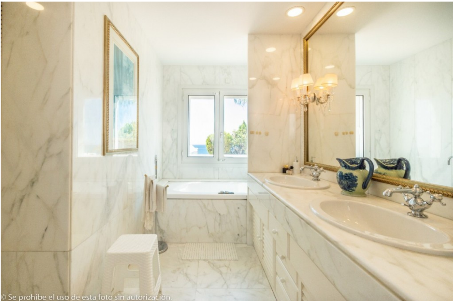
© Se prohíbe el uso de esta foto sin autorización.