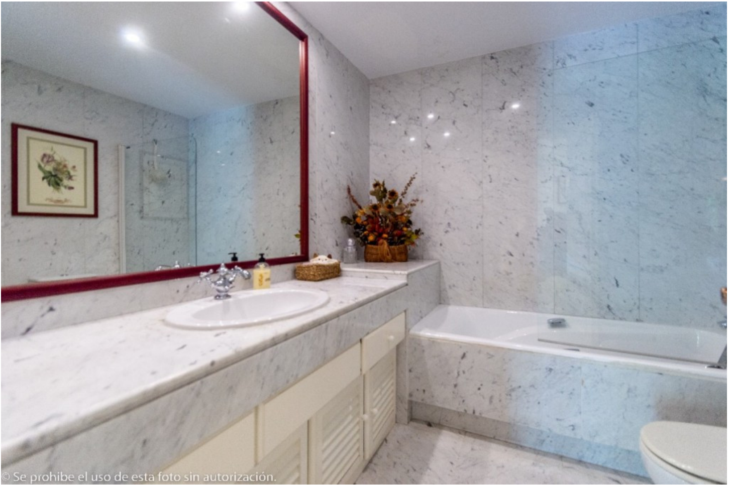
© Se prohíbe el uso de esta foto sin autorización.