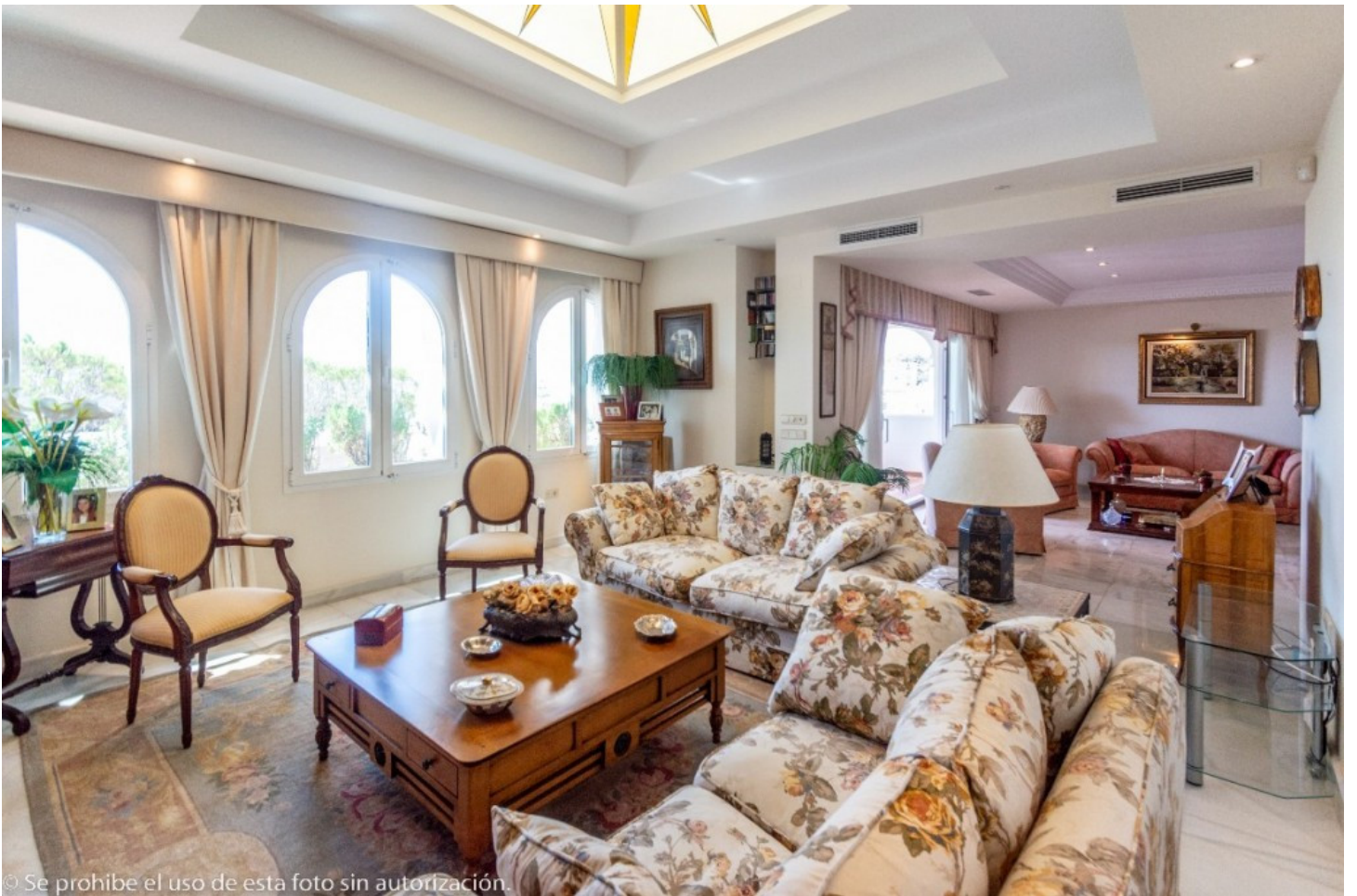
© Se prohíbe el uso de esta foto sin autorización.