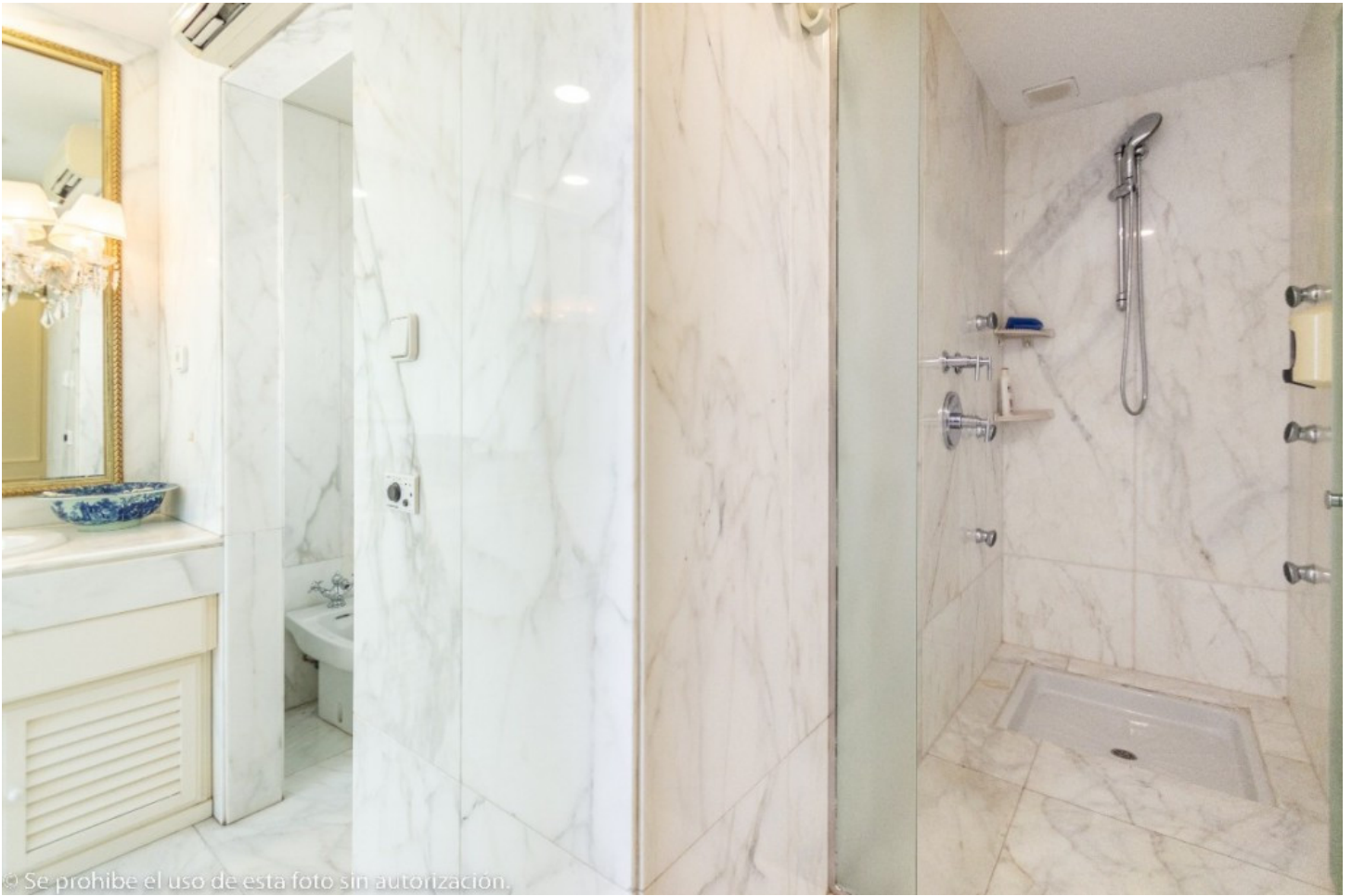
© Se prohíbe el uso de esta foto sin autorización.