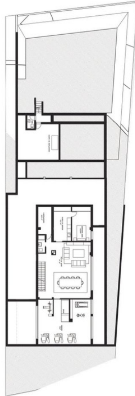
PLANTA SÓTANO BASEMENT